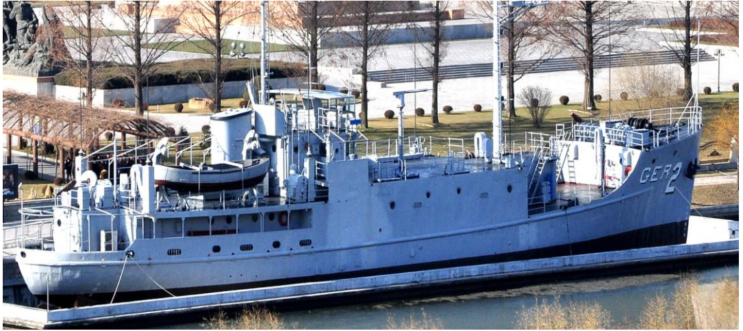
美国武装间谍船“普韦布洛”号被拴在平壤的普通江畔。