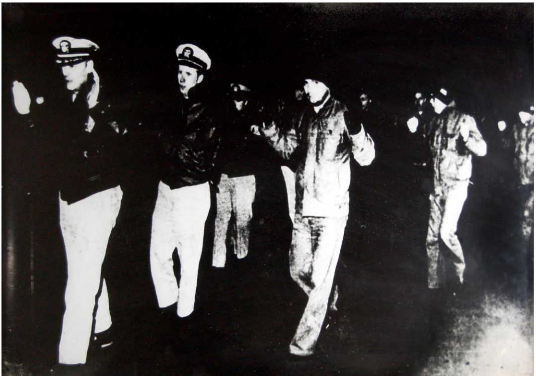
被捕的“普韦布洛”号船员

1968年1月，美国的武装间谍船为了进行间谍活动，非法入侵了朝鲜领海。当时，朝鲜人民军海军执行正常的警戒任务，发现间谍船，立即开展捕获战斗。7名水兵跳上“普韦布洛”号，仅在14分钟内捕获间谍船，俘虏了包括船长在内的军官和船员共80多人。那天就是1月23日。