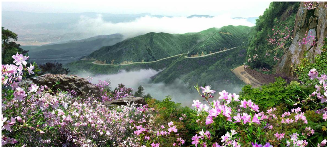
金正日国防委员长越过铁岭视察前线。

这些日子里，朝鲜壮大成为拥有强有力的军事力量的国家，朝鲜式社会主义得到加强，还打造了社会主义强国建设的牢固基础。