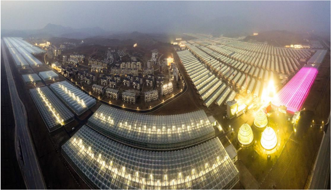
位于朝鲜首都平壤郊区的首屈一指的蔬菜生产基地——江东综合温室农场