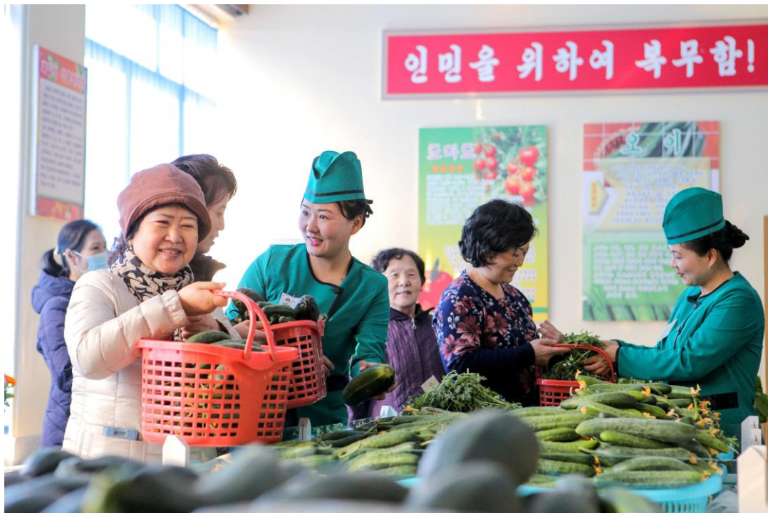
江东综合温室农场生产的新鲜蔬菜供给首都市民。