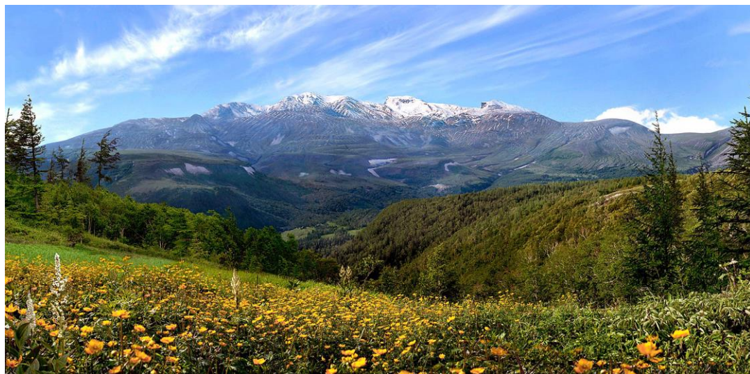
朝鲜人民视为圣山的白头山

想了解朝鲜现代历史的人和喜欢山地旅游的人可以游览朝鲜的祖宗之山——白头山（2750米）。