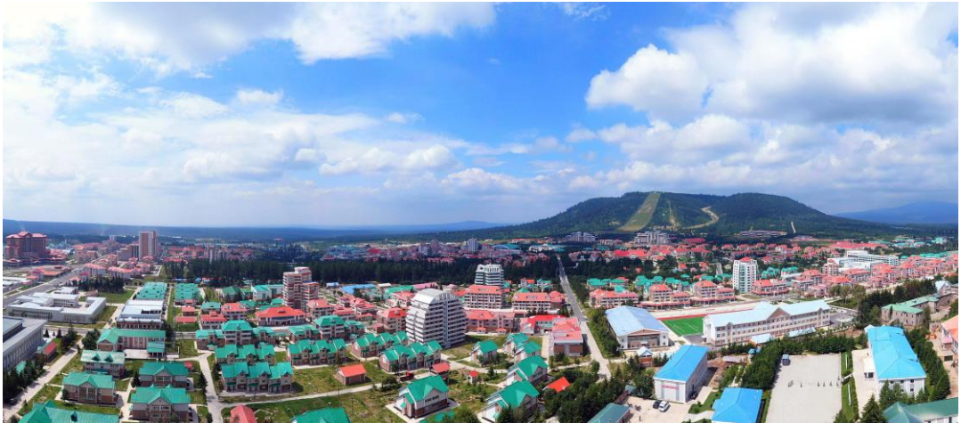
白头山脚下的山区文化城市——三池渊市