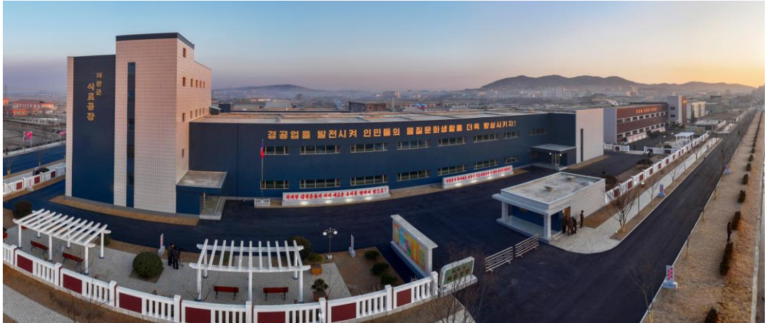
朝鲜人民军军人们建设的载宁郡地方工业工厂

金正恩总书记为了改善地方人民的物质文化生活，提出“地方发展20×10政策”，亲自向为建设地方工业工厂而组建的朝鲜人民军部队授予团旗。