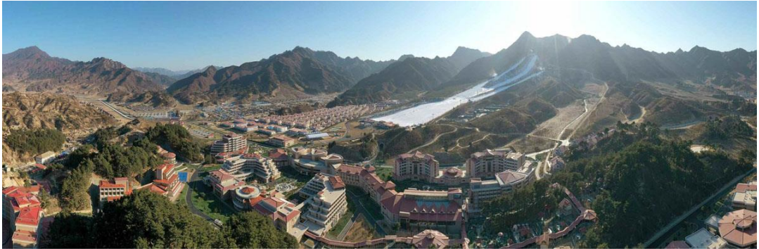
在阳德温泉文化休养地凝聚着军人们的忘我努力。