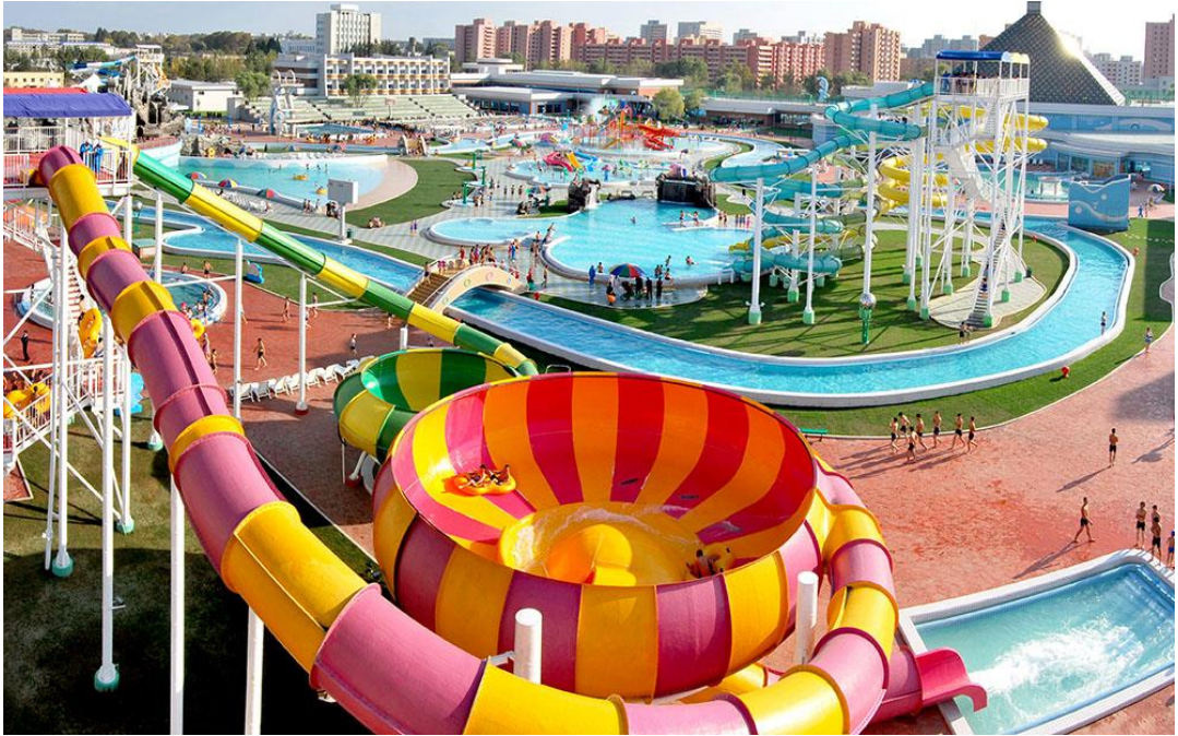
人民军人建设现代化的纹绣戏水场。