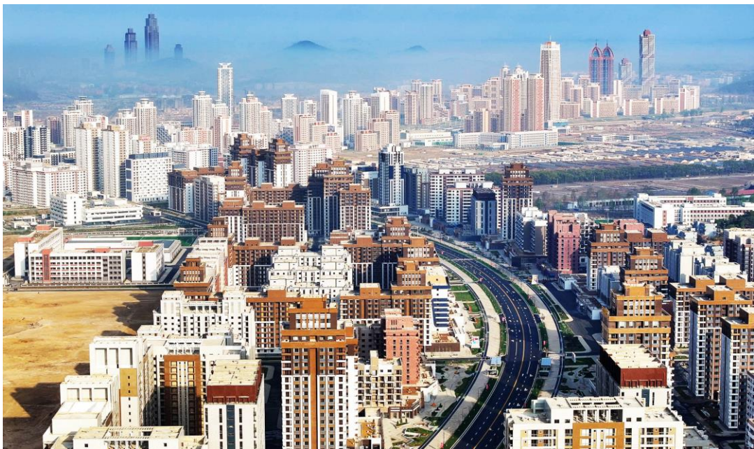
人民军军人在和盛地区建设新大街。