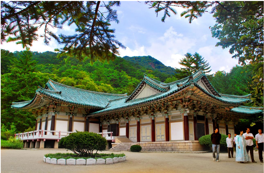
八万大藏经保存库