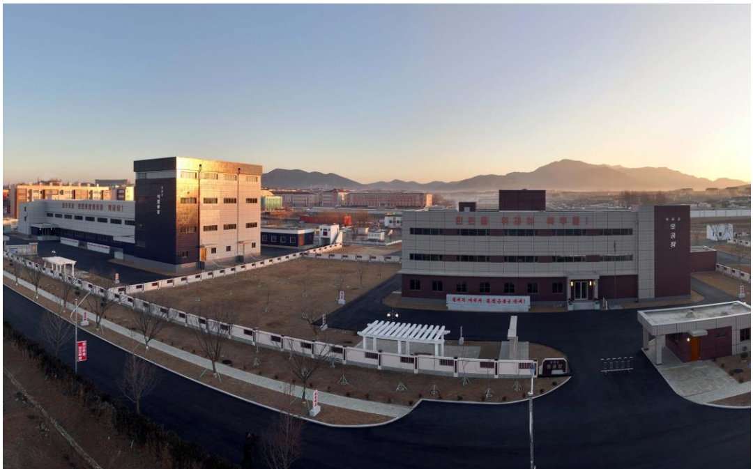
在朝鲜劳动党的地方发展政策指引下建立了地方工业工厂。