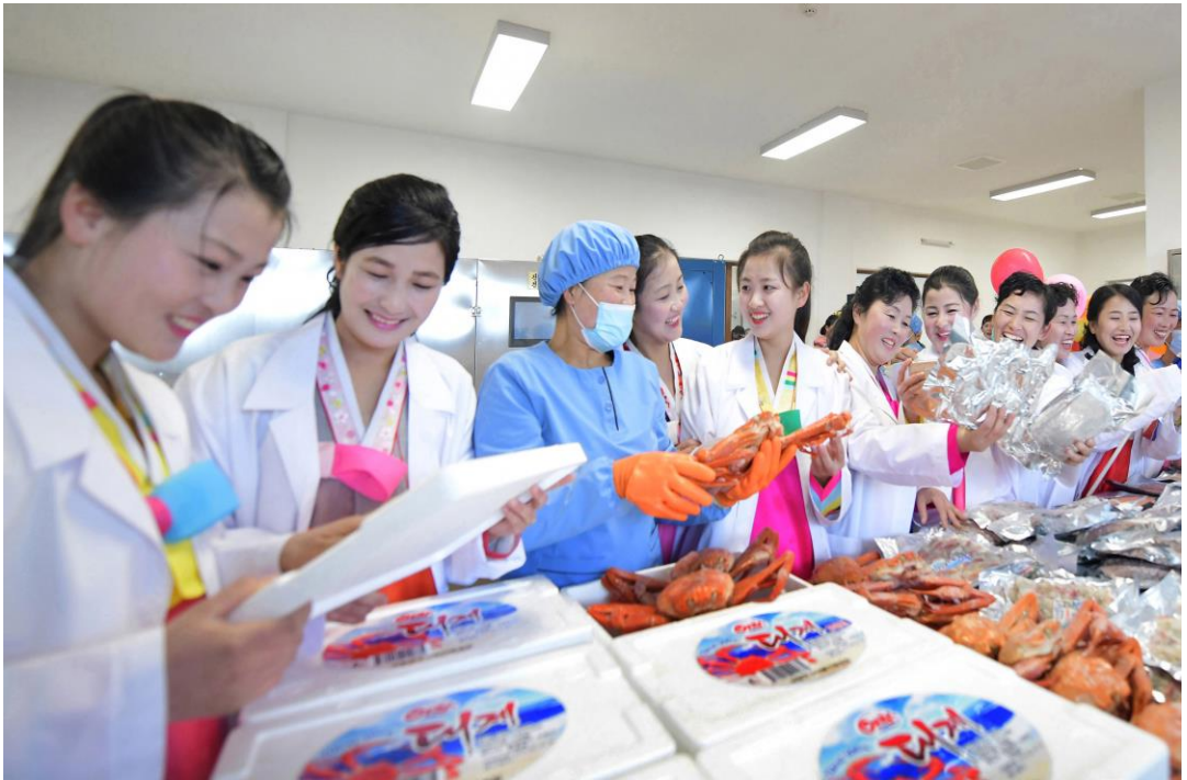
居民们看地方工业工厂生产的产品，欢天喜地。