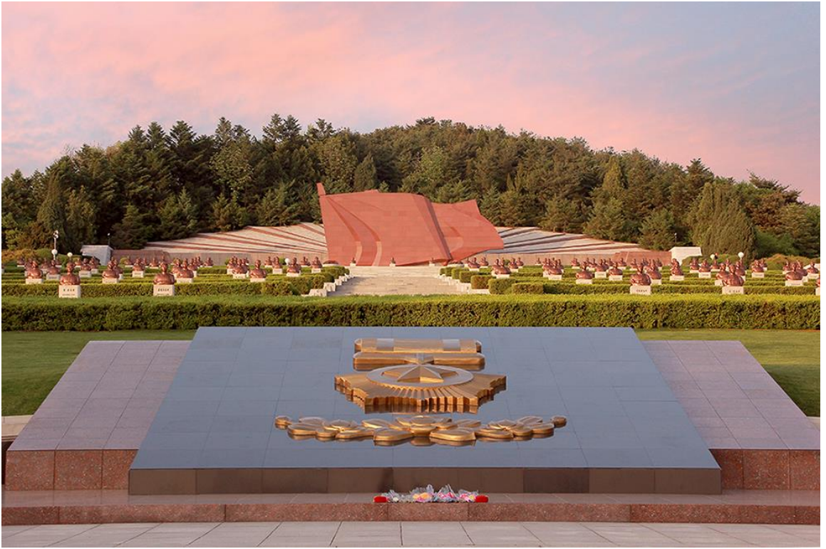
大城山革命烈士陵园全景