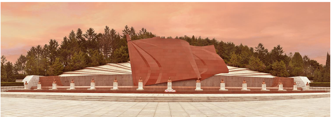
烈士陵园上端用红色花岗石塑造了旗面。