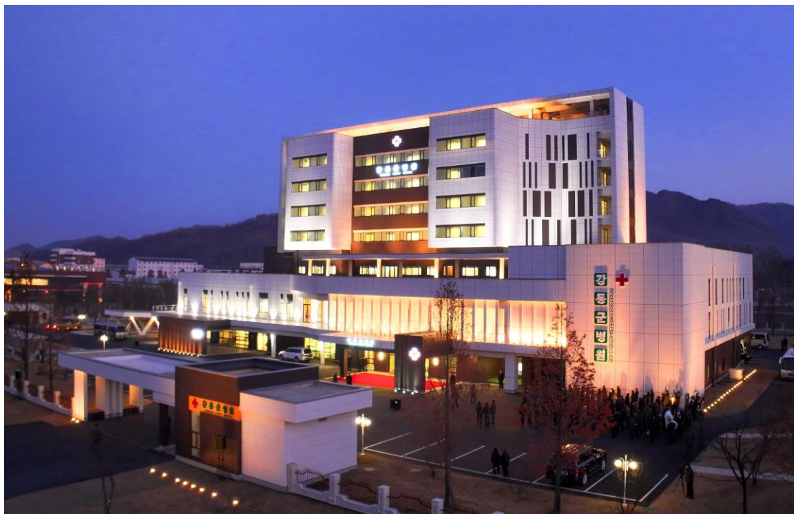
2025年11月19日竣工的江东郡医院