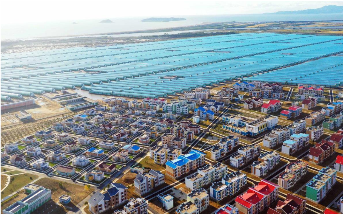
建在咸镜南道的连浦温室农场