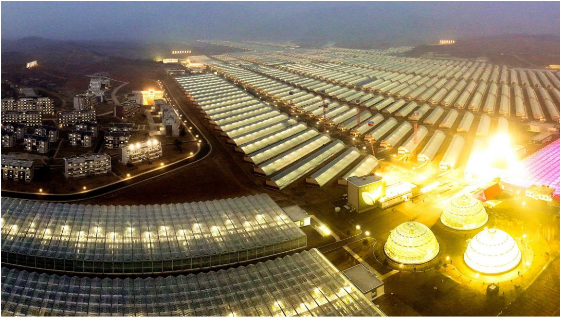
建在平壤市郊区的江东综合温室农场