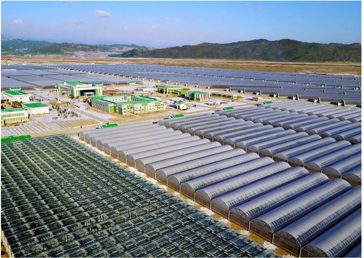
建在咸镜南道的连浦温室农场