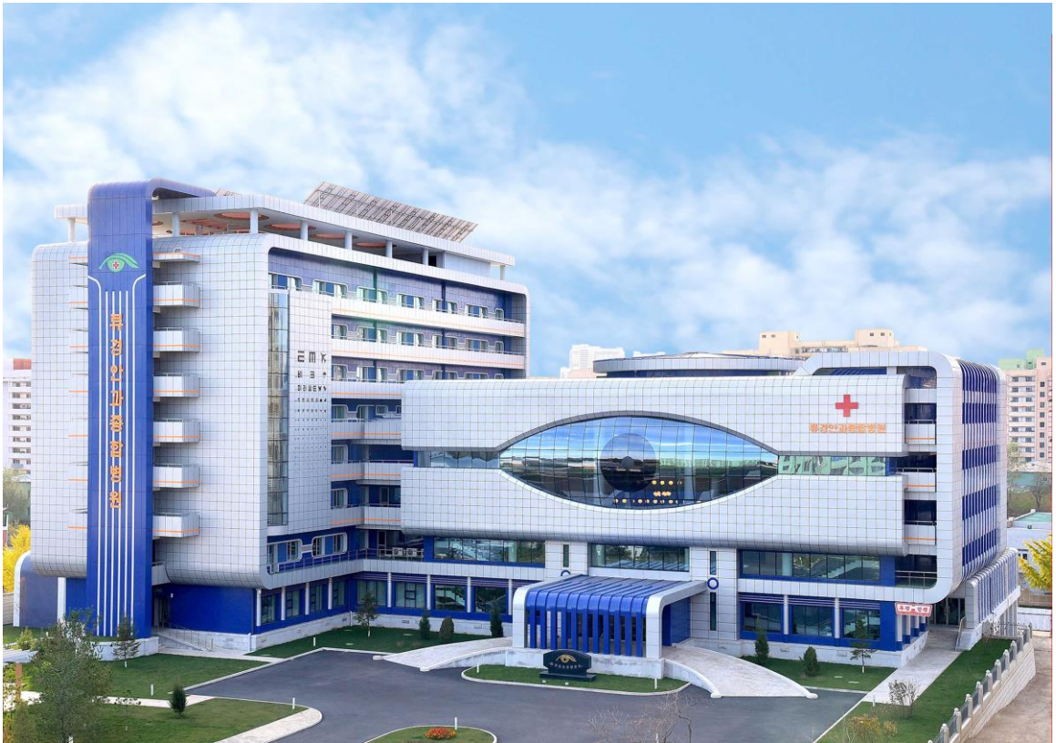
柳京眼科综合医院