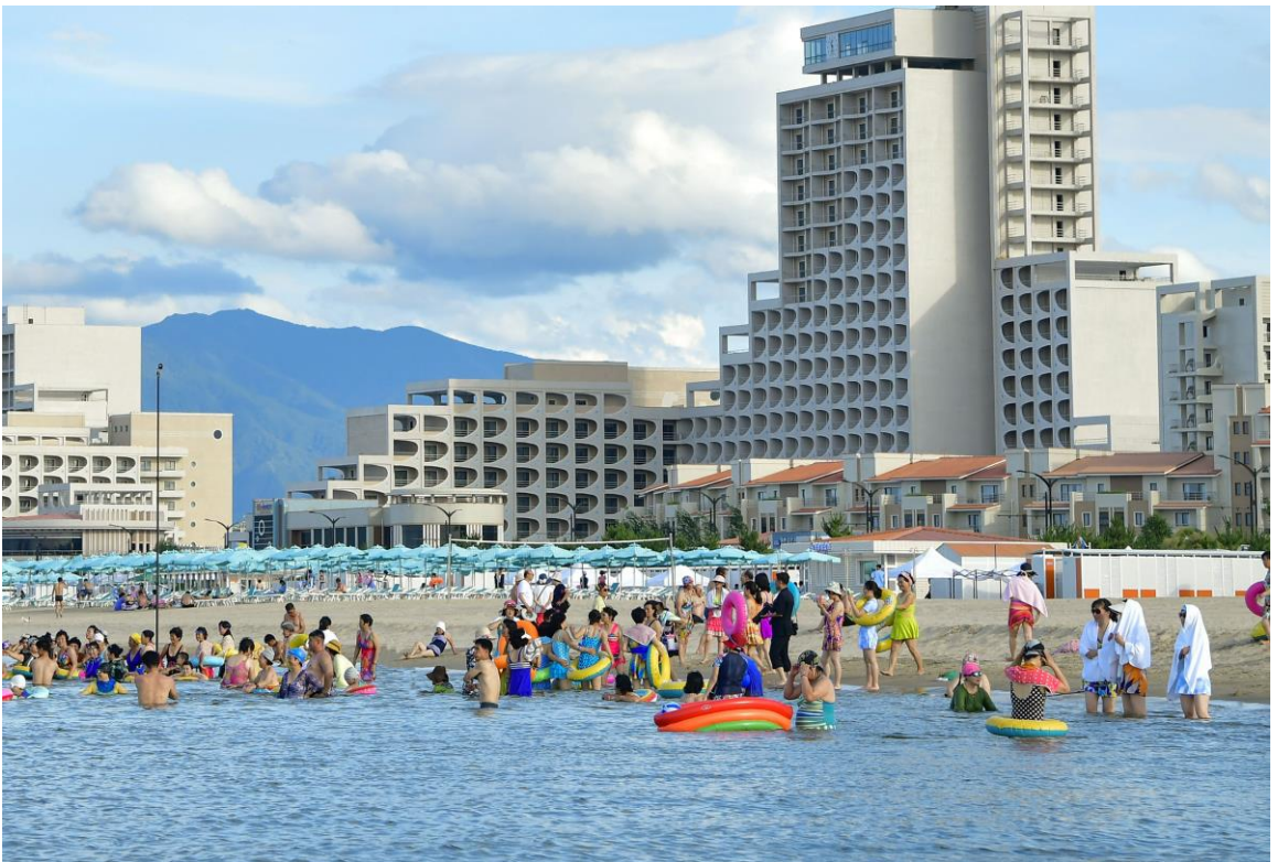
元山葛麻海岸旅游区